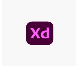
Figure 3 : Logo de Adobe XD

Adobe XD est un logiciel pour la création des prototypes à l'aspect réaliste pour transmettre votre vision de la conception et garder votre équipe alignée. Adobe XD est une plateforme de conception d'expériences vectorielles puissante et conviviale qui offre aux équipes les outils dont elles ont besoin pour créer en collaboration les meilleures expériences du monde. Disponible sur les systèmes Mac et Windows, vos équipes peuvent facilement utiliser XD grâce à sa compatibilité multiplateforme.